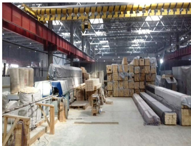
Производство комплектующих для клееного бруса