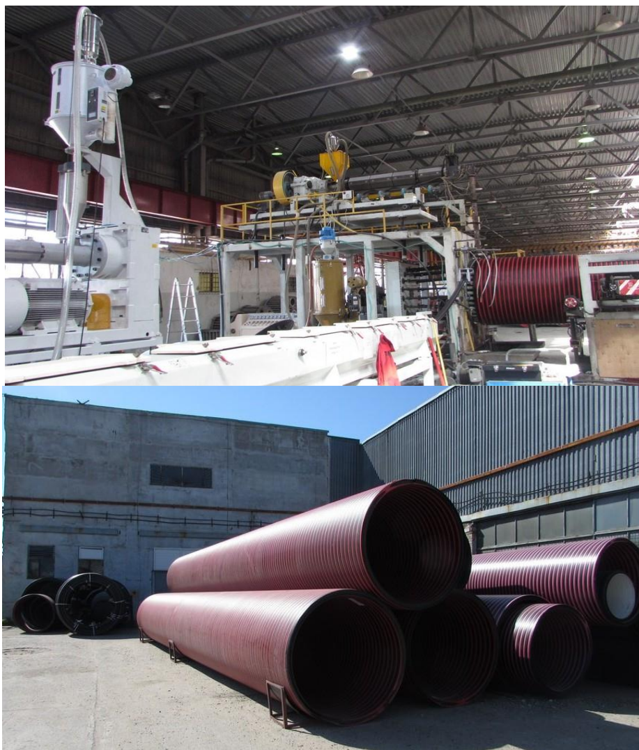
Производство полиэтиленовой трубы, d = 3\text{м} .

В ООО «Технопарк Стройконструкции» большое внимание уделено вопросам безопасности хранения товарно-материальных ценностей резидентов. Внедрена пропускная система. Территория технопарка охраняется частным охранным предприятием. По периметру территории, а также внутри помещения установлено видеонаблюдение.